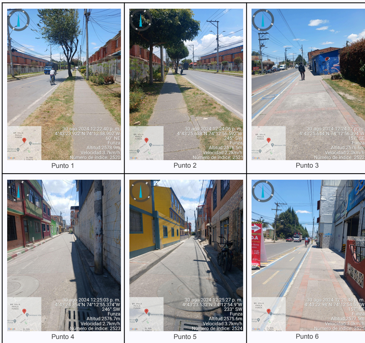
Ilustración 2. Fotos de los puntos del Recorrido de Control Y Vigilancia.